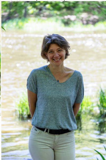
Line COLTEL (titulaire)

Installée au cœur du bourg de Saint-Brice depuis près de 20 ans, je suis enseignante en maternelle et directrice d'une école primaire en Charente limousine. Mère de 2 enfants âgés de 16 et 20 ans, je fais partie de l' ASSJ Volley depuis de nombreuses années. En 2016, j'ai intégré le bureau du club saint-juniaud et j'en suis devenue la secrétaire.