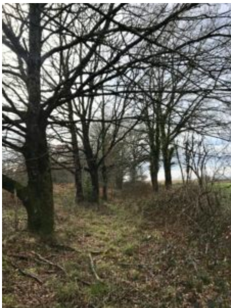
Etat actuel du chemin à préserver

Mais cela ne semble pas être le projet de la POL. L'acquisition du chemin répond plutôt au désir de rationaliser le découpage de l'espace en parcelles destinées à la vente. L'enjeu environnemental risque passer après les enjeux commerciaux, et le chemin en fera les frais. Procès d'intention, nous diront les dirigeants de la POL ; pourtant un nouveau chemin a bien déjà été tracé, appelé chemin de substitution (rapport de l'enquête publique, décembre 2019). Si nos inquiétudes ne sont pas fondées, si la POL a bien l'intention de préserver le chemin, voire de le valoriser, nous serons les premiers à nous en réjouir.