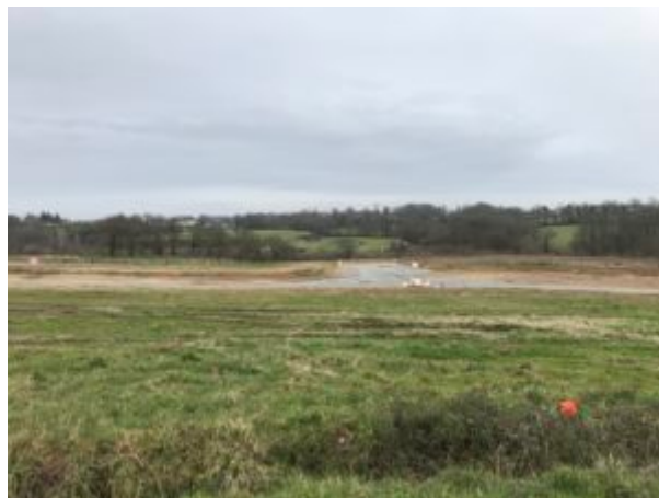
L'agrandissement du lotissement privé (61 parcelles)