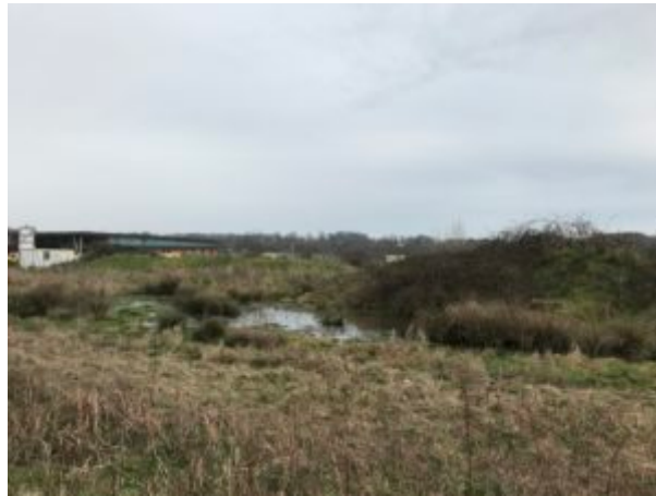
La zone humide