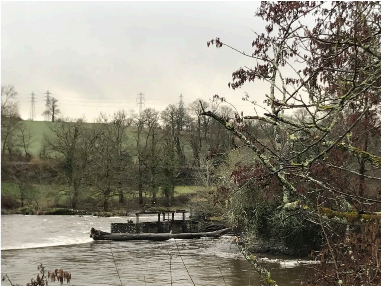
Vue de l'amont (depuis la rive droite)