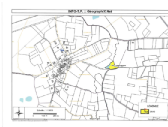
Plan de l'emplacement

Cette parcelle appartient à Monsieur BEAUNIER Jacques. Suite aux négociations engagées avec le propriétaire, il est proposé au Conseil municipal d'acquérir la parcelle cadastrée Section BN n° 49 d'une superficie de 3 560 m 2 au prix de 3 000 euros TTC.